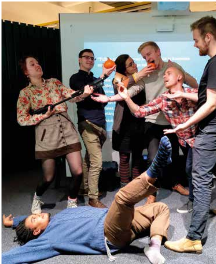
Mission Week-team i Uleåborg 2019.