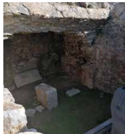
Fängelsehåla i Filippi där vissa tror Paulus och Silas satt fängslade.

Ett eget inslag under konferensen var att en del akademiker medverkade. Det var stort att höra lektorer, forskare och professorer med hög intelligens visa på att de har en djupgående andlig dimension.