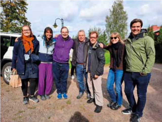
Cross-Currentin osallistujia OPKOn leirikeskuksesta Enä-Sepässä.

dollisuuksia ja olla valmiita kertomaan lempeästi toivosta, jonka Jeesus tuo arkeemme joka päivä.