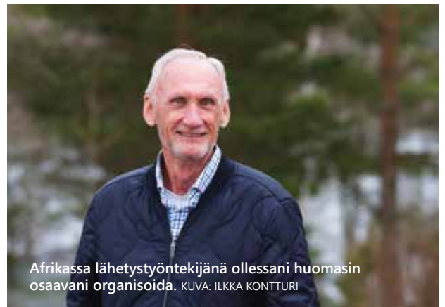
Afrikassa lähetystyöntekijänä ollessani huomasin osaavani organisoida.

Jokaisella OPKOn työntekijällä on tukirengas. Voitko sinä ryhtyä jonkun työntekijän lähettäjäksi ja liittyä hänen ystävärengaseensa? Lue lisää: opko.fi/yhteystiedot