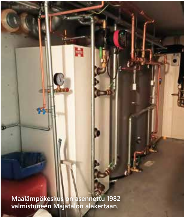
Maalämpökeskus on asennettu 1982 valmistuneen Majatalon alakertaan.