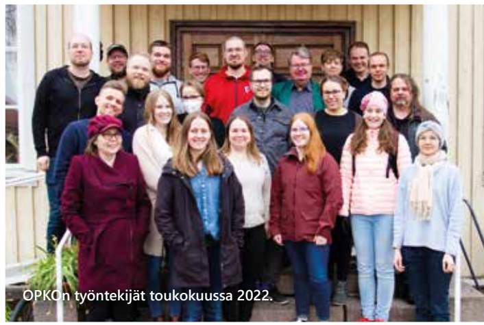
OPKOn työntekijät toukokuussa 2022.