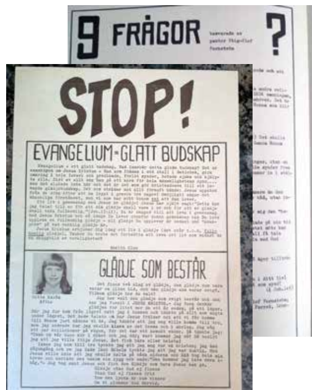
Exemplar av tidningen STOP! från år 1971.