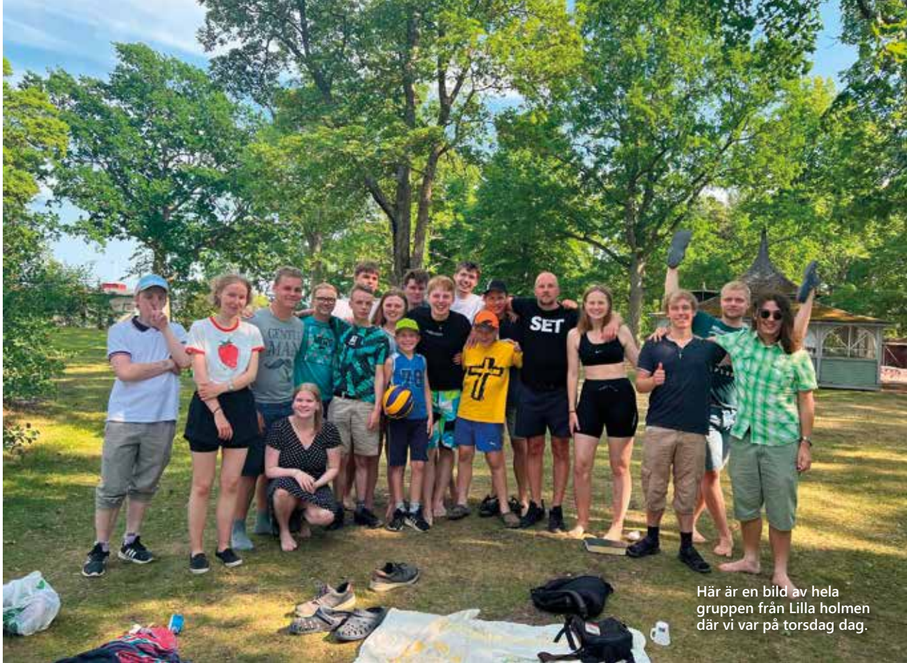
Här är en bild av hela gruppen från Lilla holmen där vi var på torsdag dag.