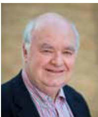
Apologeetta John Lennox on toiminut Oxfordin yliopiston matematiikan professorina.