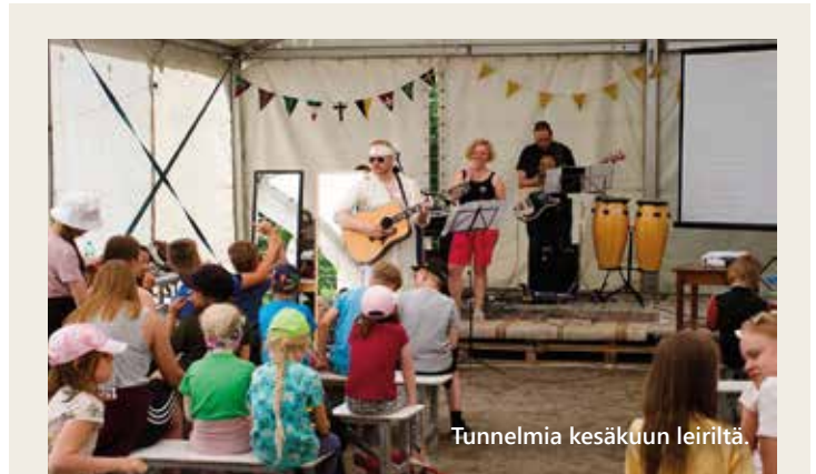
Tunnelmia kesäkuun leiriltä.