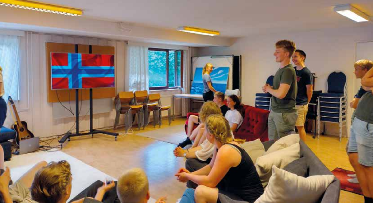
Vi höll kvällssamlingar i ungdomsutrymmet Lyktan och i Missionskyrkan i Mariehamn.