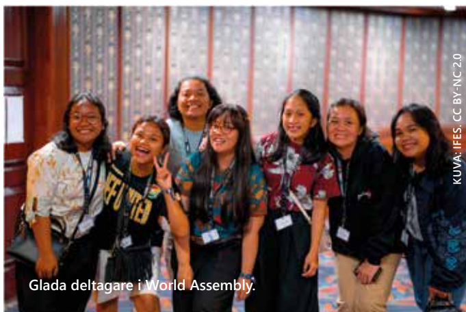
Glada deltagare i World Assembly.