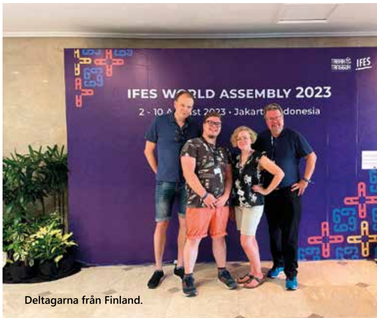
Deltagarna från Finland.