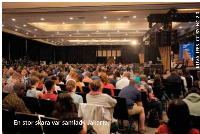
En stor skara var samlad i Jakarta.