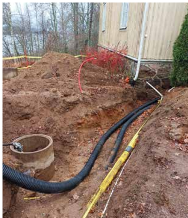
Talon alta tuleva musta putki on patteriveden kanaali. Sen alkupiste on lämpökeskuksessa Puustellin alla. Toinen maalämpökeskus sijaitsee Majatalon alakerroksessa.

Koko remontin kokonaiskustannusarvio on noin 170 000 euroa. Sitä katetaan pankkilainalla, 16 000 euron valtion energiatuella sekä OPKOn ja Enä-Sepän ystävien tuella. Remontille annettiin lahjoituksia yhteensä 38 044 €. Suurkiitos lahjastanne!