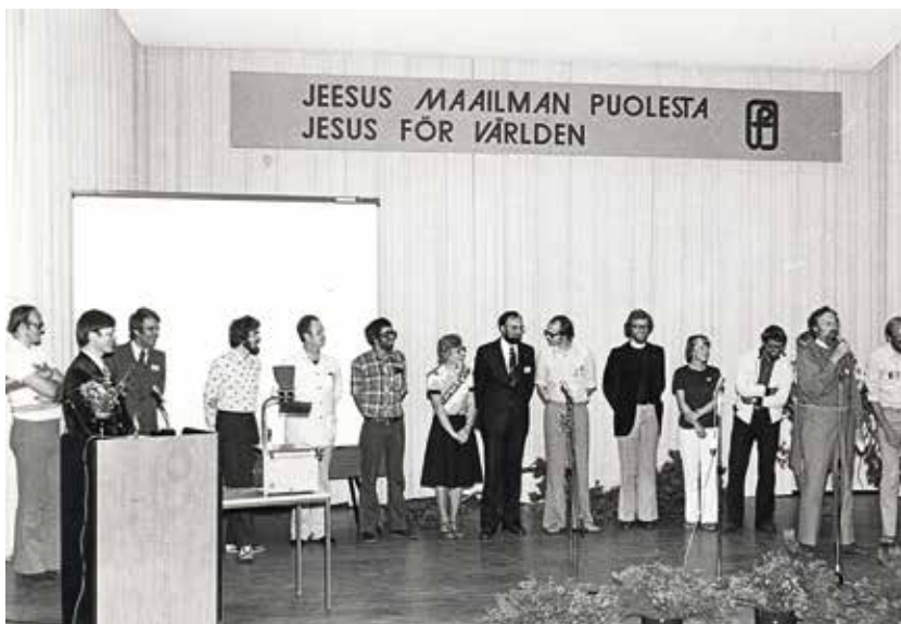
Jesus för världen.