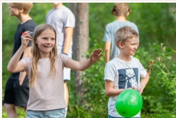
Leirillä oli laadukasta kristillistä ohjelmaa kaikenikäisillä