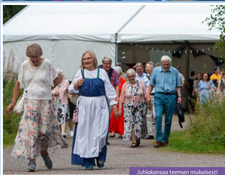
Juhlakansaa teeman mukaisesti pukeutuneena