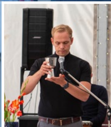
Yhteisöpäivät huipentuivat sunnuntai messuun ja pyhään ehtoolliseen