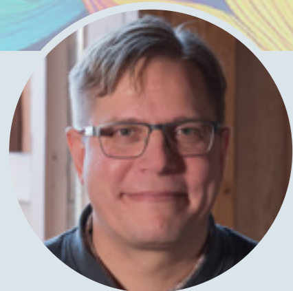
Kuva: Risto Sarsa

Kerron tässä yhden esimerkin: Akillesjänneeni katkesi viisi vuotta sitten. Akillesjänne hoidettiin kuntoon ilman leikkausta kahden kuukauden aikana siten, että jänneiden päiden annettiin rauhassa kiinnittyä arpikudoksella taasiinsa. Tänä aikana jalkaa pidettiin tiettyssä asennossa niin, että alussa kantapään alla oli paksun raamatun kokoinen määrä kantalappuja. Sitten näitä kantalappuja otettiin vähin erin pois, niin että akillesjänne sai prosessin aikana pikkuhiljaa venyä normaaliasentoon. Kun lopulta