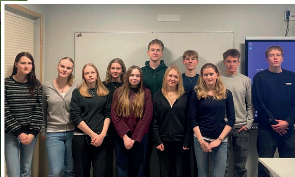
I Petalax kör man med en icebreaker-lek före man läser Bibeln och ber för varann.