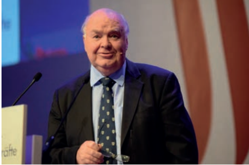
John Lennox - Kuva: Christliches Medienmagazin pro